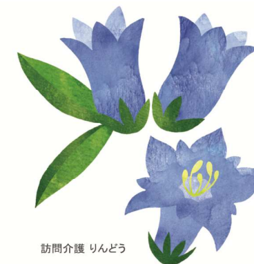
訪問介護 りんどう

訪問介護 りんどうでは 住み慣れたご自宅での生活をより快適に お過ごしいただけるようお手伝いします。